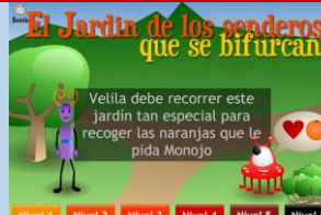
JARDIN DE LOS SENDEROS