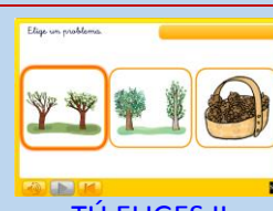
TÚ ELIGES II