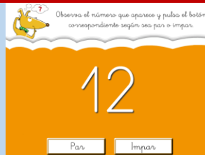
PAR / IMPAR II