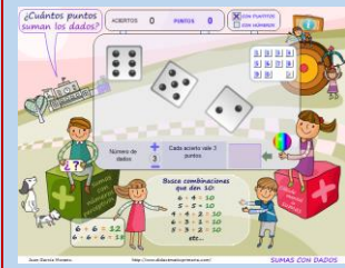
SUMA LOS DADOS II