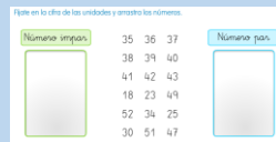
PAR / IMPAR