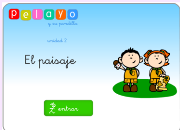
JUEGO CON EL PAISAJE