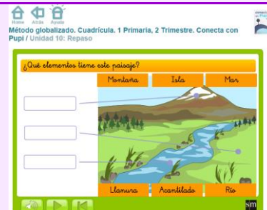
ELEMENTOS DEL PAISAJE