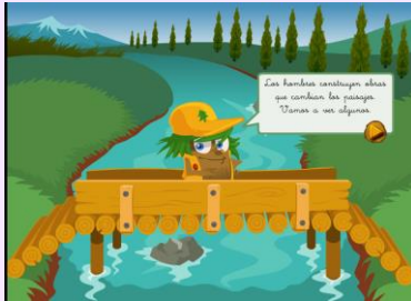
SER HUMANO Y PAISAJE