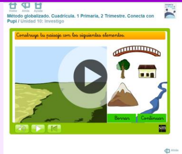
CONSTRUYO EL PAISAJE